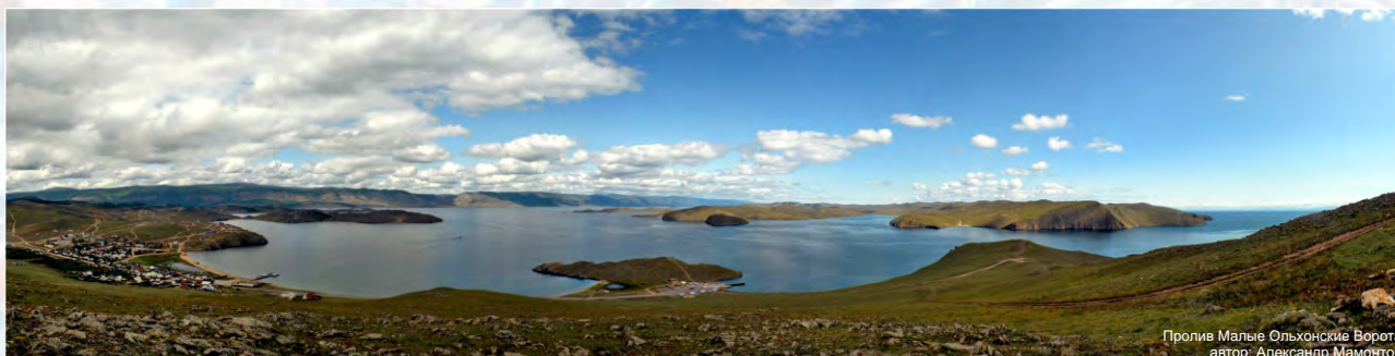
Пролив Малые Ольхонские Ворота

Для комфортного участия в экскурсиях необходимо иметь с собой подходящую для ходьбы по пересечённой местности обувь, теплую и защищающую от ветра и дождя одежду.