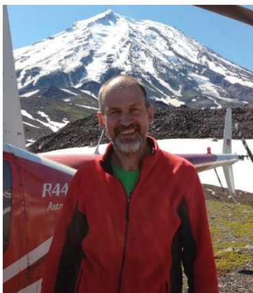
Иван Юрьевич Кулаков

оптимизировал методы управления спектральным составом турбулентных пульсаций и интенсивностью теплопереноса для широкого класса многофазных и реагирующих потоков; в исследованных системах обнаружил новые гидродинамические явления – стационарные солитоны на поверхности жидких плёнок, вихревые образования внутри крупных нелинейных волн; разработал научные основы функционирования диагностических комплексов на основе полевых методов измерения скоростей (PIV) для исследования процессов в теплофизике и энергетике. Созданная на этих принципах аппаратура, выпускается серийно и успешно эксплуатируется в научных, образовательных и производственных организациях. Публикации: автор более 300 научных публикаций. Награды: премия Правительства РФ (в соавторстве, 2014) – за разработку научных основ, создание и внедрение оптико-информационных методов, систем и технологий бесконтактной диагностики динамических процессов для повышения эффективности и безопасности в энергетике, промышленности и на транспорте, лауреат Фонда содействия отечественной науке в номинации «Доктора наук РАН» (2005, 2006). Международная премия НАН Белоруссии им. академика А.В. Лыкова. Имеет благодарность президента РАН.