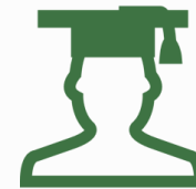
Аспиранты и ординаторы